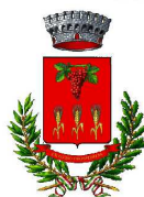
BAGNOLI DI SOPRA